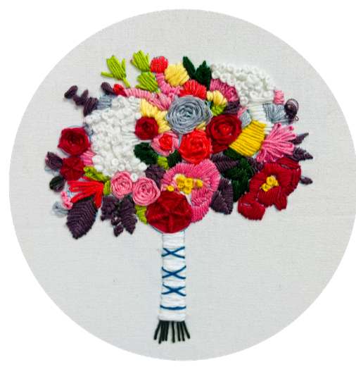
《刺绣》 作者：程韵帆 指导教师：景婷婷