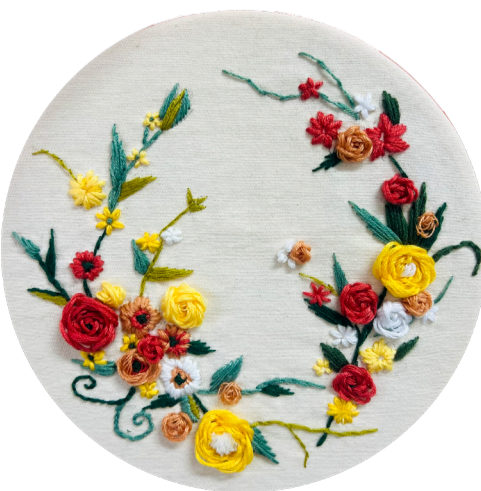
《刺绣》 作者：宋德帅 指导教师：景婷婷