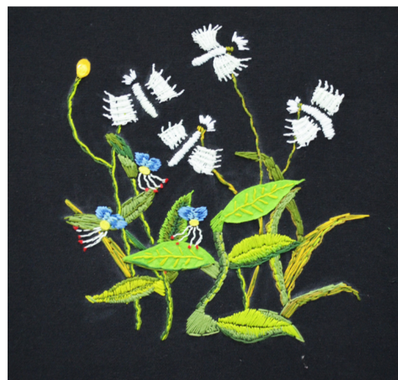
《刺绣》 作者：陈浩 指导教师：周珊珊