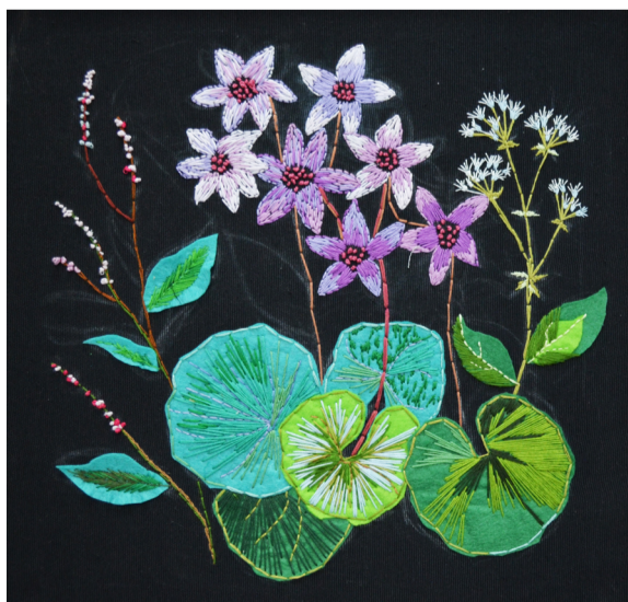
《刺绣》 作者：郑佳一 指导教师：周珊珊