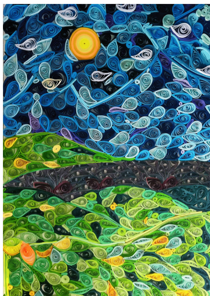
《装饰画》 作者：杜海峰 指导教师：石向飞