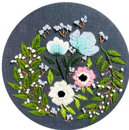
《刺绣》 作者：吕艳艳 指导教师：景婷婷