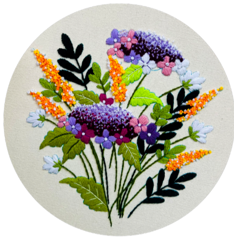
《刺绣》 作者：李姝宁 指导教师：景婷婷