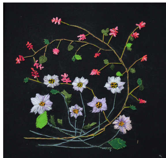
《刺绣》 作者：张艺璇 指导教师：周珊珊