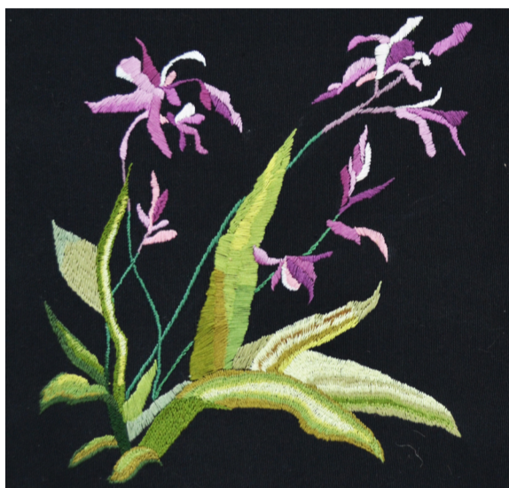
《刺绣》 作者：宋帅 指导教师：周珊珊