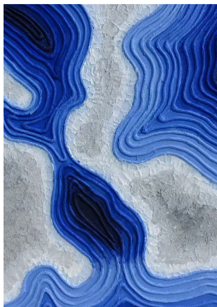
《装饰画》 作者：宋宜珈 指导教师：石向飞