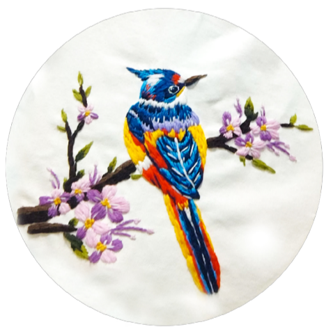
《刺绣》 作者：李欣雨 指导教师：陈若凡